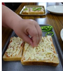
チーズを たっぷり のせて。