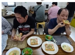
おいしくて。 無言で食べる…