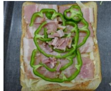
ピーマン、ベーコンも。 じゅんび オッキー。 トースターへ GO!