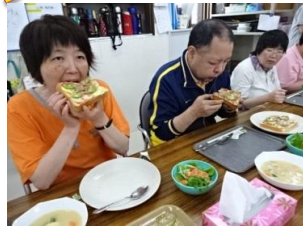
もぐもぐ。パンは サクサク。 チーズは トロトロやなあ~。