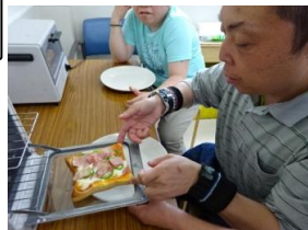
「あっちっ。」 そおと ださなきゃ。