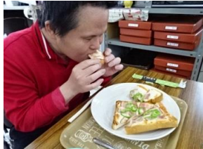
ゆっくりと 味わう。