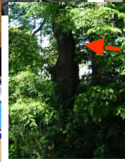
りっぱな木を スケッチ。 第2あいの 周りには、自然がゆたか。