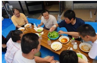
「野菜も 食べなあ〜。」サラダ菜を、焼き肉のタレにつけて、パクパク。