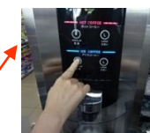
アイスはレギュラーで。