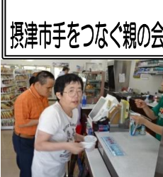
コンビニで体験。アイスコーヒーを。