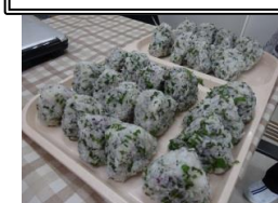
青ジソと ゆかりを ませて、昼食に おにぎり。