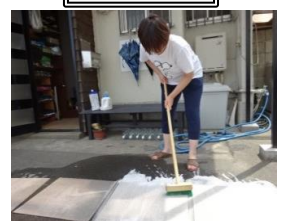
『さあ〜、きれいにしますよ〜！』力を入れて、ゴシゴシ。