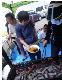
いい具合に焼きました。「お肉 ください。」