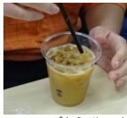
シロップとミルクを入れて完成。コーヒープレイク！