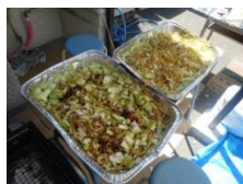
メは、焼きそば。キャベツやタマネギ、野菜たっぷりヘルシーに。