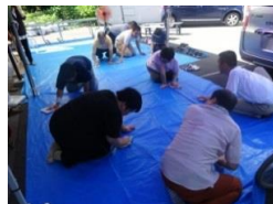
後片付けも大事。みんなで、ブルーシートをふいて、きれいに。