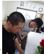
お祝いの言葉をのぞき込んで…少し てる？