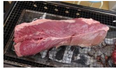
あみの上に、どん！ ハラミのブロック肉。

バーベキューは、やっぱり外ですね。テントの中で、わいわい、にぎやかに。フランクフルトは、みんなに大人気。