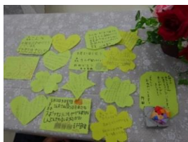
利用者さんからのメッセージカード。星やハート、色々な形に お祝いの言葉を のせて。