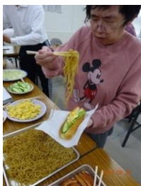
好きなものを たっぶり のせて。 さいごに、 やきそばも のせて。