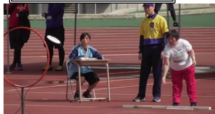
輪の中めがけて、ディスクが飛ぶ。