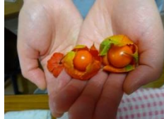
ふくろを あけたら、 きれいな まんまる。