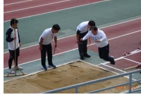
立ち幅跳び。 はじめての 金メダル。