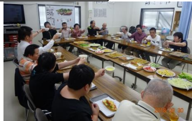
自分だけの ホットドッグが 出来あがり。 コーンスープで かんぱい！