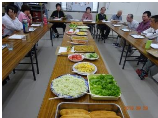
今回は ホットドッグづくり。 前には、たくさんの具材。 ワクワクしてきたあ〜。