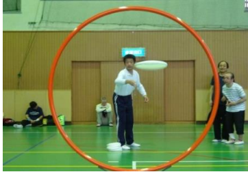
アキュラシーの練習。 「わ」の中にはいるように。