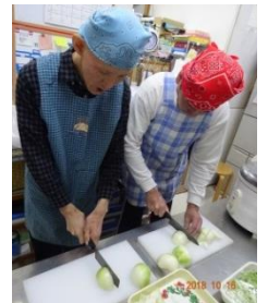
かたなをもつように。 ザクッと タマネギを まっぴたつ。 はじめての 包丁。