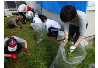
みんなで 草ひき。 草って… すぐのびる。