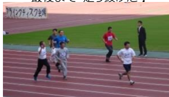
必死で 追いかける！ 100m走。