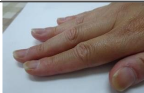
見て見て！ きれいな つめになった。 がんばった！！！！！！