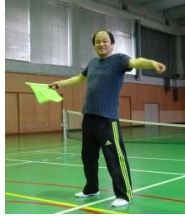
ぼくが 判定。 うでを 広げたら、 「わ」の中に はいらなかった合図。