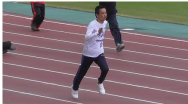
スピードに のって。 最後まで 走り抜けた！