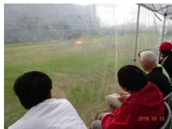
保護シートを 下ろしてもらって見学。 消火器の 薬剤で 真っ白に。