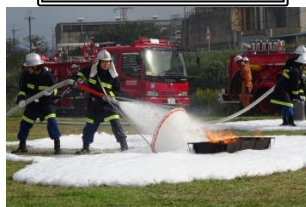
あわが、シュワシュワっと 広がって。火が消えていく。