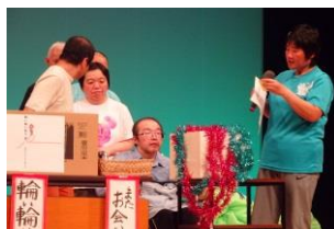
助けあって。 みんなで 抽選会を もりあげる。