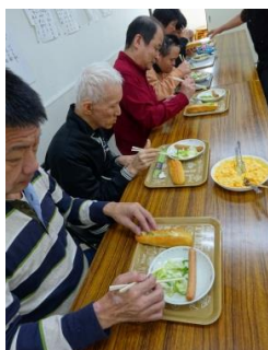
ホットドッグ づくり。 大きな ウイナーが 美味しそう。