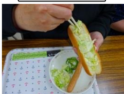
大きく 開いて。 キャベツ、ピーマンを つめこむ。