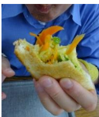
カレーで味付けした 野菜たっぷりの トースト。ヘルシー。 「うまい!」