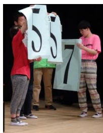
「はじめて 番号ふだ もった。 うれしかった。」