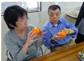
これは スーパーで 買った 大きい柿。 「甘いかな？」 おやつに。