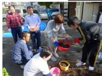
土はこび。 バケツに せっせと。 いれる人。はこび人。 チームワーク ぱっちり!