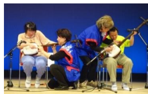
はじめて持った しゃみせん。 きんちょうしたあ〜。