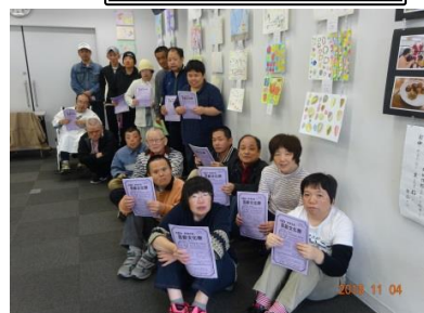
絵画教室での 作品。 (ご指導 本田佳郎氏)