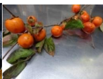
第2あいの柿は、 しぶがき。 しぶを抜いて、 れいとう。 シャーベット柿に。