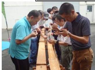
そうめんが流れてきた！ たくさんすくって... 食べることに夢中。