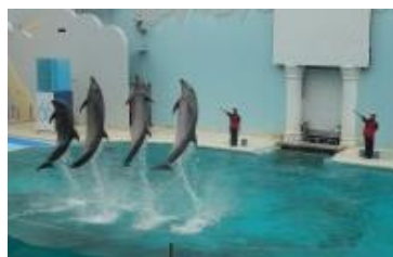
イルカの ライブショーを見学。 みごとな ジャンプ！ 【いっしょう けんめい 練習したんだらうね〜】