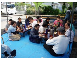
テントでひとやすみ。 ミカンや シュークリームを たべたり、ジュースを のんだり... (ちよっと たべすぎかな〜)