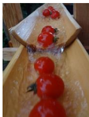
まっかな ミニトマトが コロコロと。