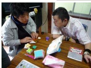
おりがみ 「ど〜おるの？」 「こう 折るやる。」