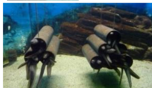
アナゴは 穴が好きなのかな？ つつの中には、たくさんの アナゴが、グニョグニョ。