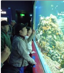
「でかい！」「おもしろい顔してる！」 おおきな すいそうに いろいろな お魚が 気持ちよさそうに。