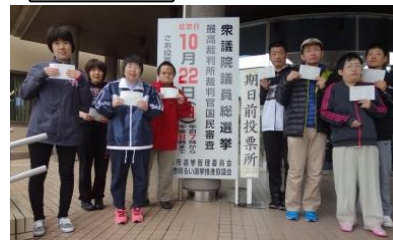
選挙の日は、台風が来るかもしれないと、 期日前とうひょうに 行きました。