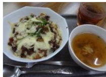
ドリアと たまねぎの 皮から作った スープ。