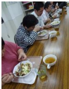
「おいし〜い」「はじめてたべた！」 フォークとスプーンを上手につかって。