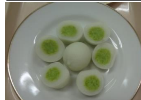
宮城めいぶつ 『ずんだもち』を いただきました。 【プレミアムフライデーは 今回でおいしい】