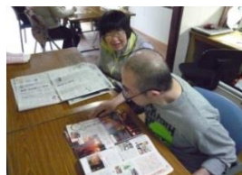
話しかけ... いつも やさし〜い。