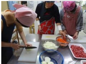
たまねぎ、にんじん、ぎゅう肉...