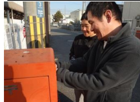
とどくのがたのしみだ「ワン!(いぬ)」