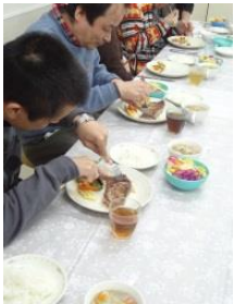
ミディアム? レア? 「いい具合に焼けてるな〜。」