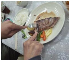
ナイフとフォーク。 うまく使えるようになってきた。