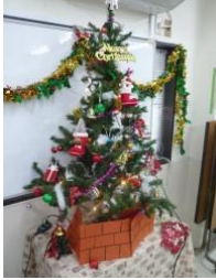
利用者さんが飾ったクリスマスツリー。