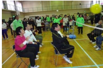
『 かんとう賞 』をいただきました。 来年こそは、決勝リーグへ!