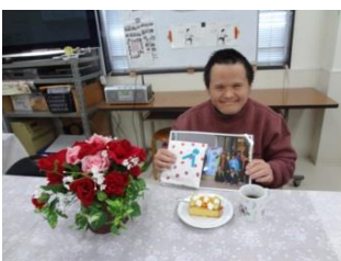
山田さん おめでとう。 プレゼントにっこり。ケーキには、大好きなパイナップルが。