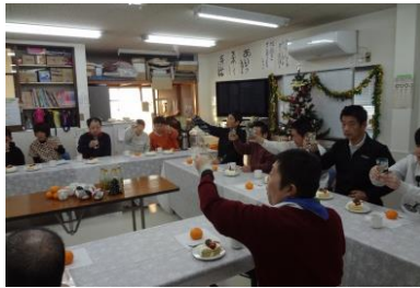
「メリ〜 クリスマ〜ス!!」 利用者さんからの強い希望に 負けました!!! ごうせいに サーロインステーキだあ!