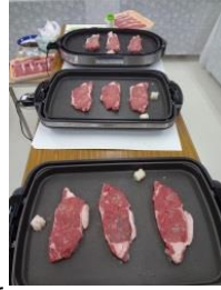
見守る中、サーロインステーキが焼かれる。