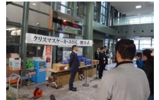
市役所で ケーキとみかんの贈呈式がありました。(佐竹食品株式会社様から)