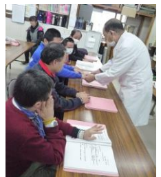
利用者さんと あくしゅ。「今年も一年 ありがとう。」