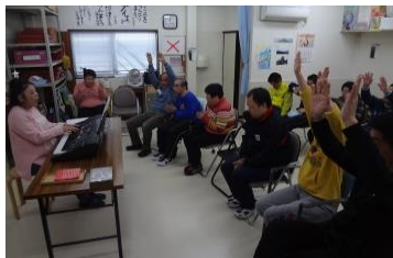
今年最後の音楽教室! 体を動かして、カいっぱい歌ったよ。