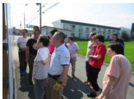
選挙に 出る人の名前と顔を 確認。