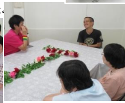
誕生日会が始まる前に、おしゃべり。いい笑顔。