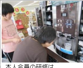
本人会員の研修は、コンビニでアイスコーヒー作りを体験。