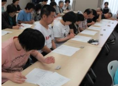
利用者さんも 本人会員として資料を手に。