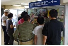
投票を 終えて。摂津市物産品展示コーナーで。「これ 知ってるワッ」