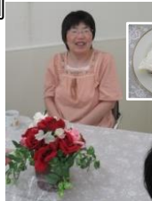
入船さん おめでとう。今日は、オシャレ。