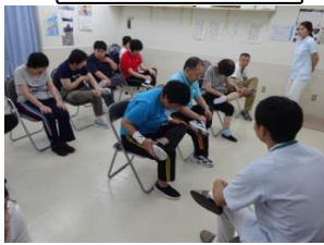
理学療法士さんのストレッチの指導。足、できない!