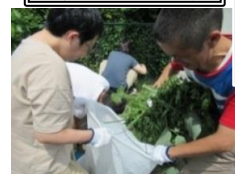
『しっかり ふくろ 持っててね』 後片づけも協力して。