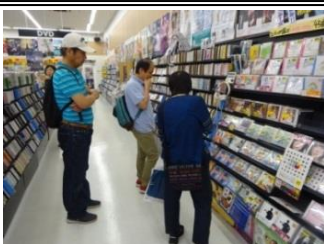
「うたが 大好き」CD売り場を 見学したり、本を さがしたり...