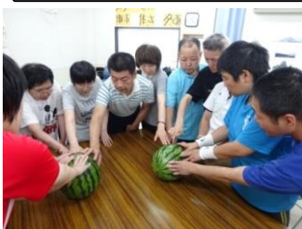
みんなで さわって。手ざわりも 楽しんで。