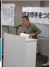
大きな声で司会進行。