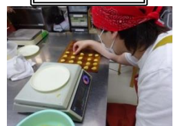
グラム数も、バッチリ。手ざわりよく 並べて。