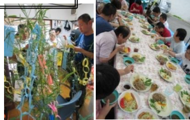
一人ひとりが、短ざくに「ねがい」をこめて。