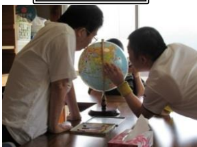
ニュースで見た 国をさがす。 ちきゅうぎで。