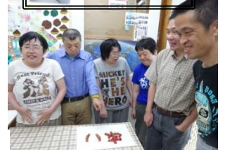
収穫したイチゴで あい。 みて!みて!