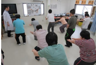
ゆっくり 腰を下ろして。 なかなか むずかしいな~。