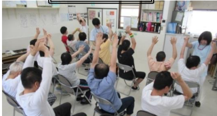
バンザ~イ で体をほぐす。 看護師さん・理学療法士さん(2人)の こまやかな ご指導で まずはストレッチ。