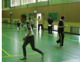
ディスクをとり、 走る 走る!