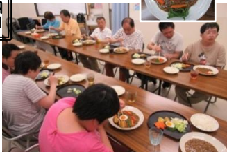
カレー。自分のものは 自分で 盛り付けました。