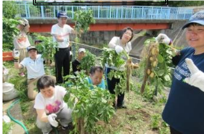
第2あいの農園で、草取りもして じゃがいもが 大きくなった。