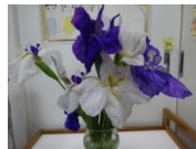
しょうぶの花。 いただきました。